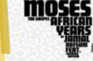
Portada de "The Gospel African Years"