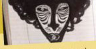
Máscara 'a la Moses'