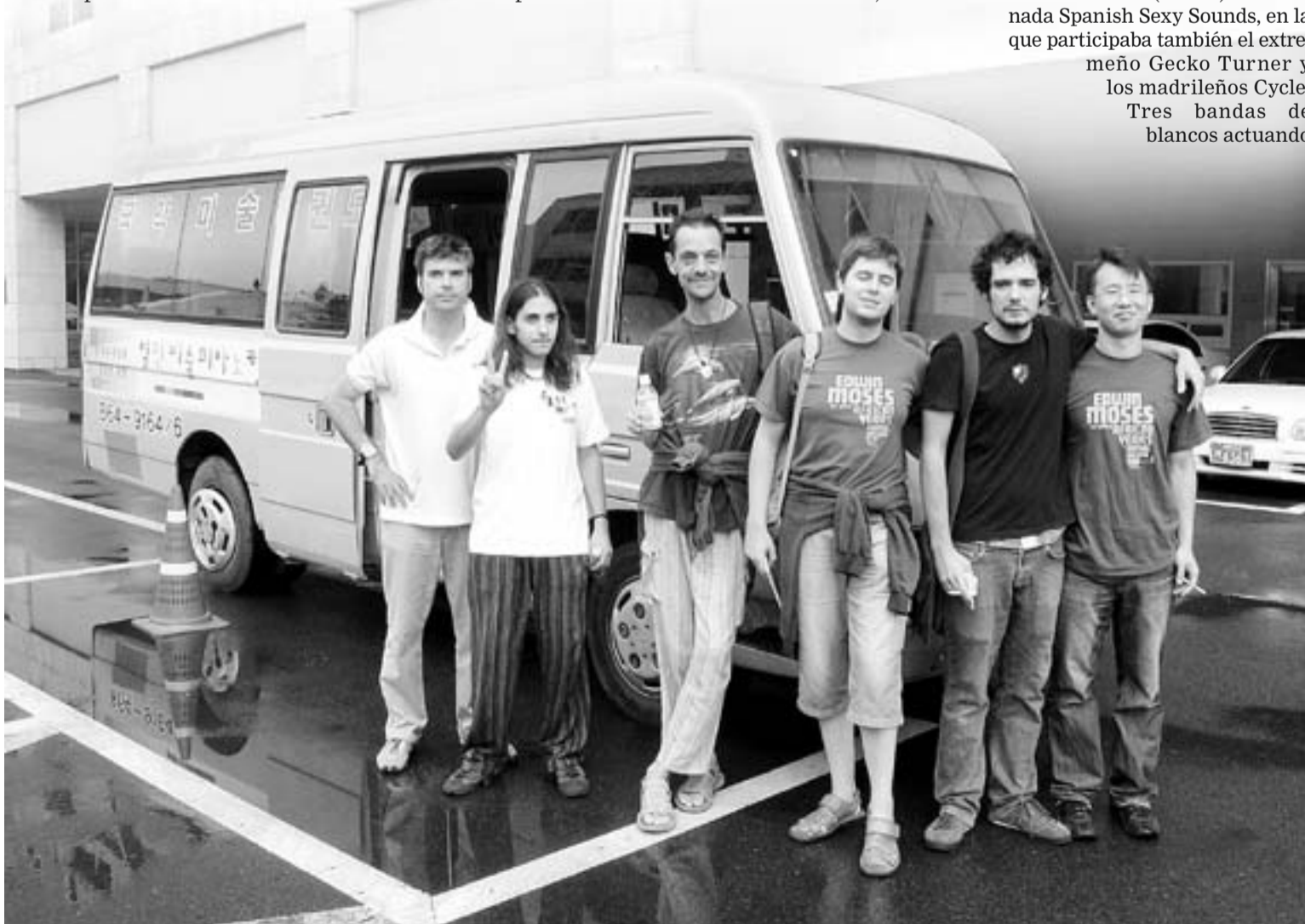
CAMARADERÍA. Los músicos con Mister Park, el conductor de la furgoneta rosa que pusieron a su disposición en Seúl.

Braña se ocupó de filmar los conciertos y material abundante para un falso documental de investigación donde rastrearían el posible paso del legendario Edwin Moses por Asia en los años 70. Quién les verá preguntando por la calle a un sintecho