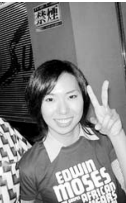
Vigil con una fan.