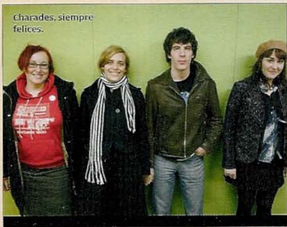
Charades, siempre felices.